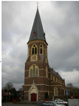
Sint-Kristoffelkerk uit 1906