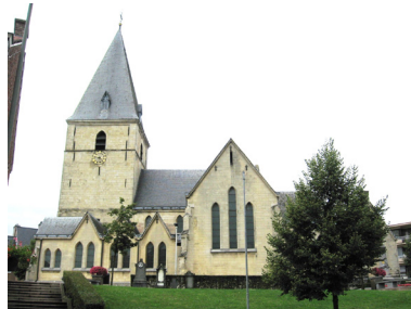
O.L.Vrouw Tenhemelopneming Zutendaal

In het begin van de 13e eeuw werd op deze plek een romaanse kerk gebouwd (de onderbouw van het koor is bewaard gebleven). In 1304 verwierf de Abdij van Averbode het patronaatsrecht van Zutendaal: de paters bouwden prompt een nieuwe kerk (bewaard: de toren en de middenbeuk).